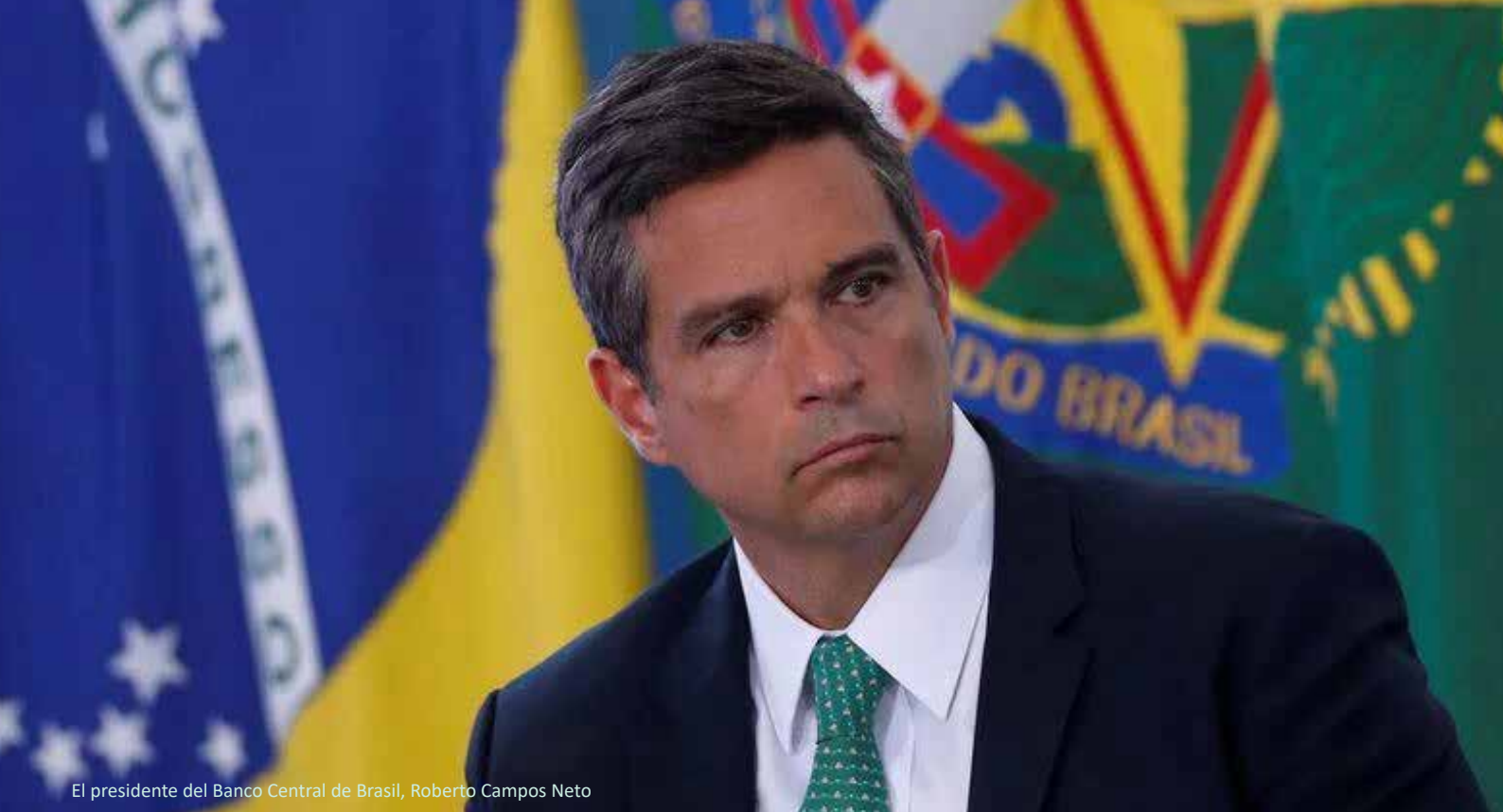
El presidente del Banco Central de Brasil, Roberto Campos Neto

de la eficiencia, la resistencia al control gubernamental y la preservación de la privacidad de los usuarios. Además, el enfoque en la descentralización y la transparencia en lugar de la concentración de datos personales ofrece una mayor seguridad. Las criptomonedas, en última instancia, fomentan la libertad y la propiedad individual.